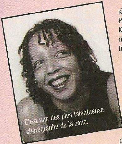
C'est une des plus talentueuse chorégraphe de la zone.

● Quand vous aurez lu « Techni'ka, » le livre de LénaBlou, les danses Gwo-ka n'auront plus de secret pour vous